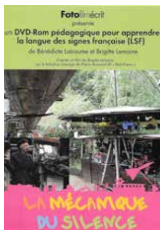
LA MÉCANIQUE DU SILENCE