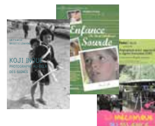
LES TROIS DVD