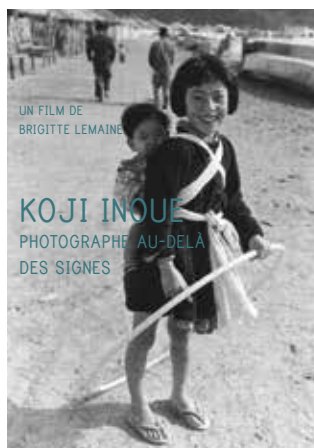
KOJI INOUE PHOTOGRAPHE AU-DELÀ DES SIGNES